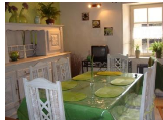
Coin repas vue 2