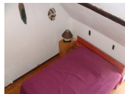
Chambre niveau 1