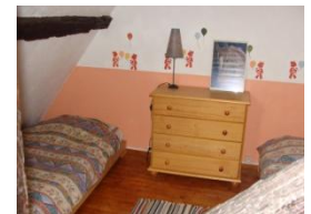
Chambre niveau 2

LE RELAIS est mitoyen aux autres gîtes dans un corps de ferme comportant 4 gites. Le gîte donne sur la cour de la ferme il ya un barbecue et salon de jardin. Au rez-de-chaussée un séjour avec coin cuisine comprenant micro-onde, four, cafetière, lave vaisselle, réfrigérateur, tv et lecteur dvd, Lave linge et lave vaisselle. A l'étage, Une salle d'eau avec douche et WC, sèche cheveux, un coin salon, un lit de 2 personnes et un lit pliant de 1 pers et à la mezzanine ; deux lits de une personne.