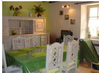
Coin repas vue 1