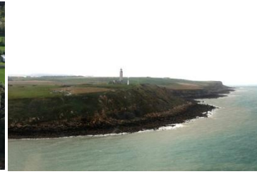
Cap- Gris -Nez