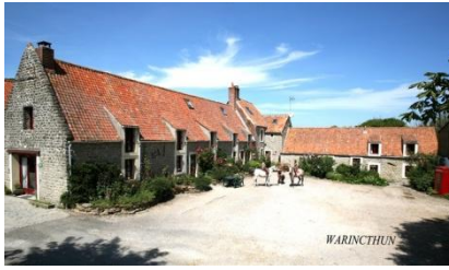
Le corps de ferme

LE RELAIS - Capacité 4 - 5 personnes - Superficie Totale = 55m 2