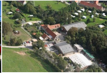
Vue du ciel